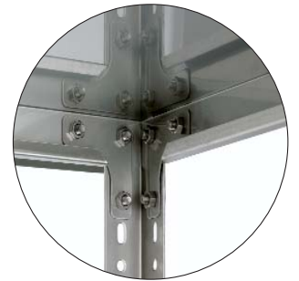
Gesamtstabilisierung durch Eckplatten